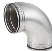
LWF B 160 - 90 VA